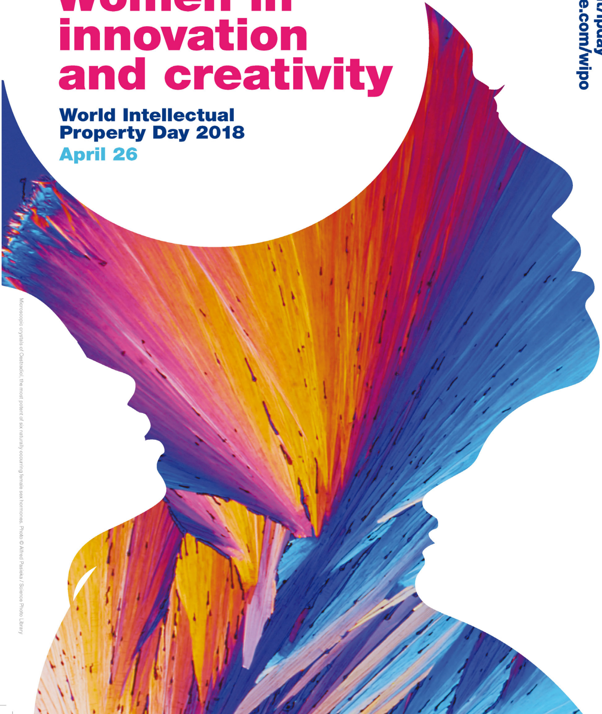
Microscopic crystals of Oestradiol, the most potent of six naturally occurring female sex hormones.

#worldipday wipo.int/ipday youtube.com/wipo